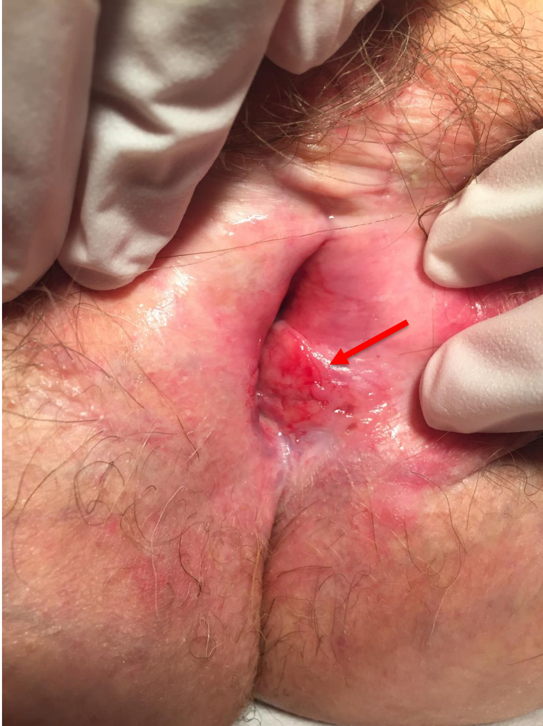
Illustration 7. Cancer de la vulve siégeant au niveau de la fourchette vulvaire (flèche) survenant sur un LSAV ancien et évolué. Notez la disparition complète des reliefs vulvaires.