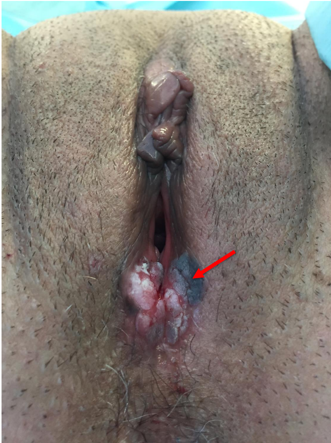
Illustration 4. VIN différencié de la fourchette vulvaire de forme érythroleucoplasique (flèche). Le LSAV est bien visible ici, prédominant au niveau de la fourchette vulvaire, avec une disparition de la partie postérieure des petites lèvres alors que le capuchon clitoridien est préservé.