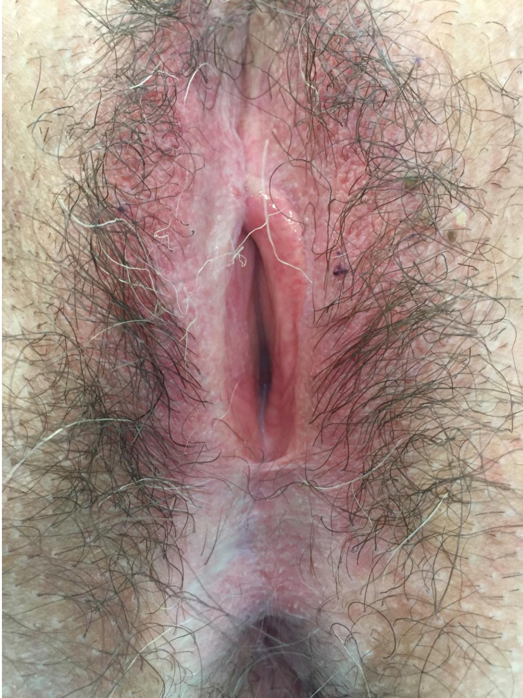
Illustration 1. Aspect typique de LSAV. On. Note l'aspect blanc nacré et érythroplasique avec une quasi disparition des reliefs vulvaires.