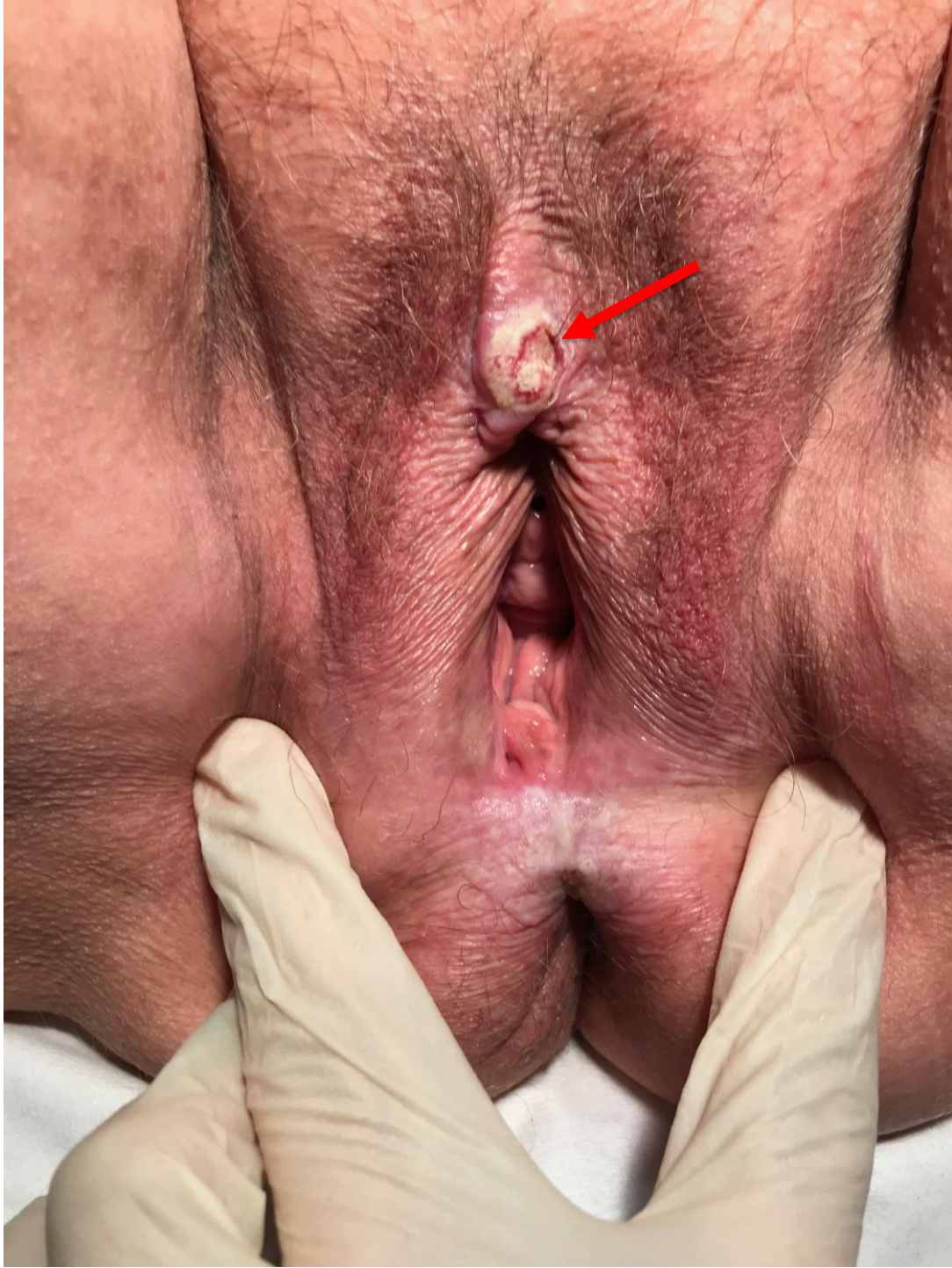
Illustration 6. Cancer du capuchon clitoridien (flèche) survenant sur un LSAV caractéristique.